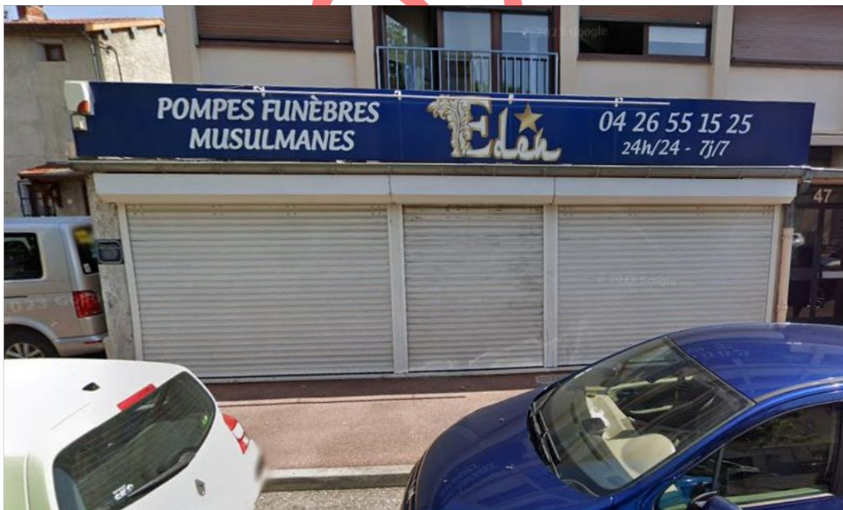
Façades avant du local

Le local ne dispose pas de cave ni de grenier associé.