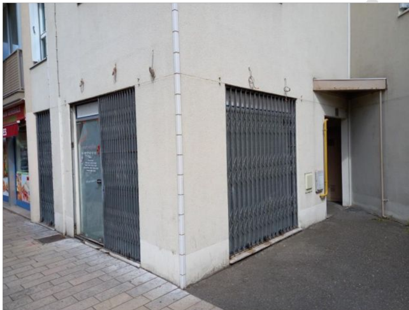
Façades avant et latérale du local

Le local ne dispose pas de cave ni de grenier associé. Il est compris dans un ensemble immobilier géré en copropriété.